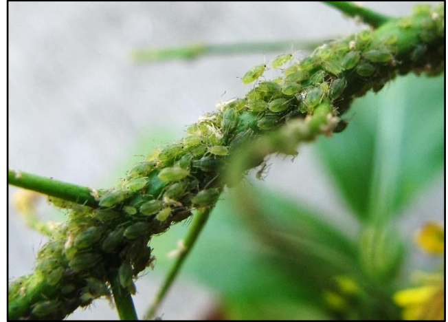
圖 2：蚜蟲群集於菜心莖上為害