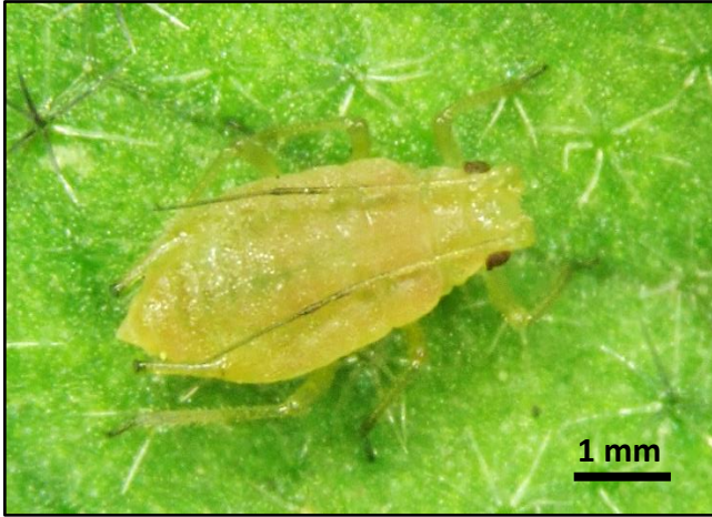
圖 1：蚜蟲體長約 2 – 5mm