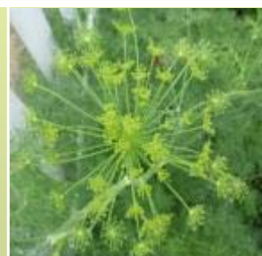
茴香 Dill, Fennel