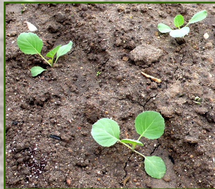
幼苗以品字形排列， 株行距約60公分 (24吋)