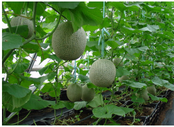
溫室內栽種網紋甜瓜

近年園藝組使用環控溫室及有機方法試種不同品種的網紋甜瓜。向農友推廣栽種的優良品種如綠白肉的“天綠”及橙紅肉的“紅鷹”，都很受消費者歡迎。栽種網紋甜瓜，除要熟識曾於前期通訊所介紹的一般種植管理外，亦要掌握選蔓留果、人工授粉及保果等技巧，才可獲得理想收成。今期就以上述的兩個品種作例子略述。