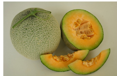
橙紅肉網紋甜瓜(紅鷹)