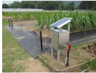
20. 電圍網 防止野生動物破壞農作物