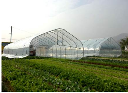
19. 保護設施零件和物料 用於豎設簡單的保護設施， 以保護作物免受豪雨及／ 或蟲害雀鳥侵擾。