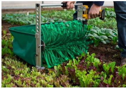
15. 手提式收割機 用於收割作物。