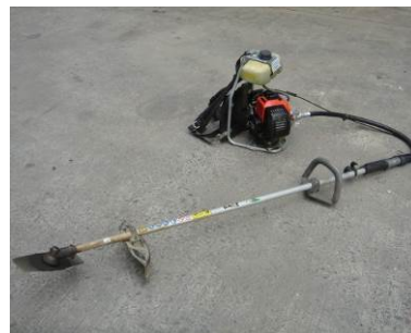
6. 剪草機 用於清除雜草、矮樹及野生灌木。