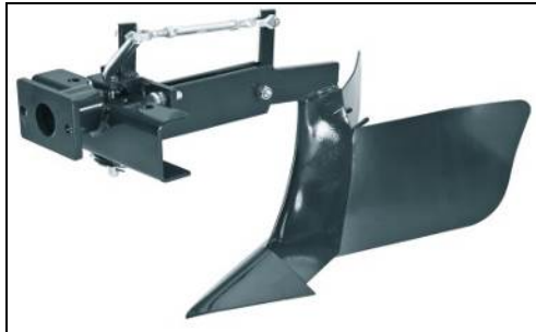
3. 開溝(培土)器配件 安裝於犁田機或旋耕機後方， 用於把鬆土收集和堆放到一行 行種植的幼苗旁。