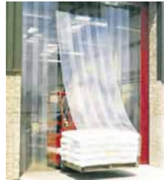
22. 隔鳥屏障 用於防止野鳥進入的 膠條簾幕或鏈索門。