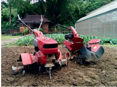
1. 犁田機 用於在耕作前翻鬆表層泥土。