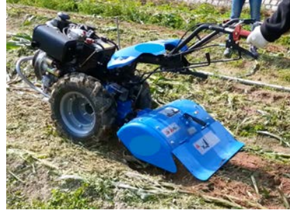
2. 拖拉機裝配的旋耕器 用於在耕作前打碎壓實的泥土。