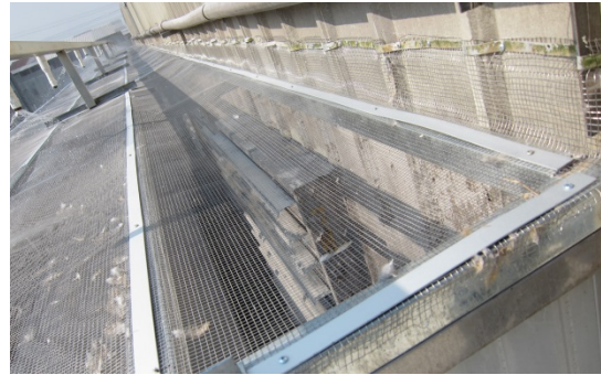
26. 灑水系統 置於雞舍抽風機外，以減少雞毛飛散。