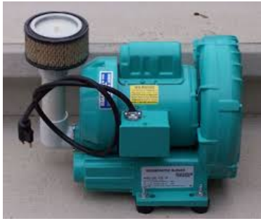
25. 曝氣池泵氣機 用於處理禽畜廢物的曝氣池。