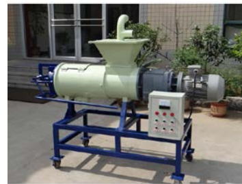
24. 固體液體廢物分離機 用於分離禽畜廢物中的固體及 液體，以提升處理效率。