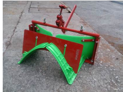
4. 起壟器 安裝於犁田機或旋耕機後方， 用於在耕作前為隆起於鬆土上 的土床定形。