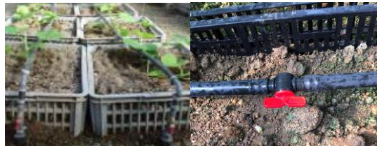
18. 灌溉系統零件和物料 用於設置灌溉系統。