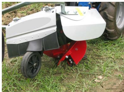
5. 旋動犁 由拖拉機驅動，用於開墾新地、 鋪設隆起的土床，以及在堅硬土 層挖掘排水坑。