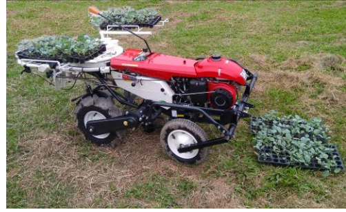
14. 移植機 用於移植幼苗到土床上。