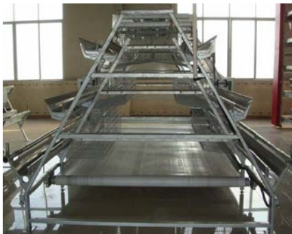
23. 輸送帶式清糞系統 用於清除雞隻糞便。