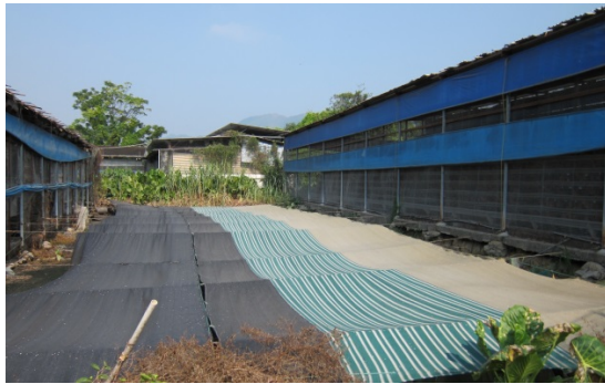
21. 覆蓋廢物處理設施的物料 用於減少異味散逸。