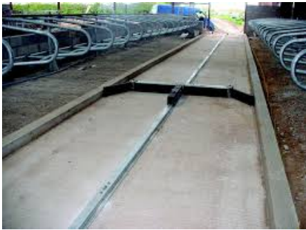
27. 自動刮糞系統 用於清除禽畜廢物。