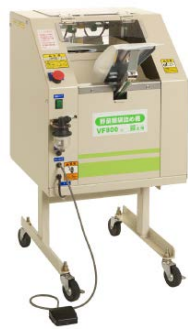
17. 蔬菜包裝機 用於包裝已收割的蔬菜。