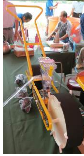
13. 種植機 用於精確地直接播種到土床上。