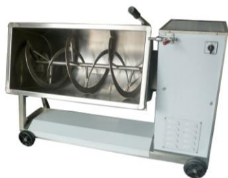
33. 混合機 用於攪拌和調配禽畜飼料，以提升禽畜養殖的質素，也可用於其他農用物資廢料，以加強農場的管理。