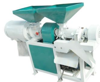
34. 飼料研磨機 將粒狀飼料(例如粟米)研磨成粉，以便調配飼料及餵飼禽畜，從而提升養殖的質素。