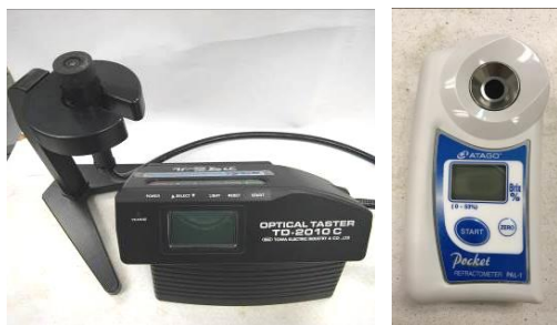
31. 電子糖度計 用於初步測試農產品的甜度，以掌握採收時機和管理農產品質量。