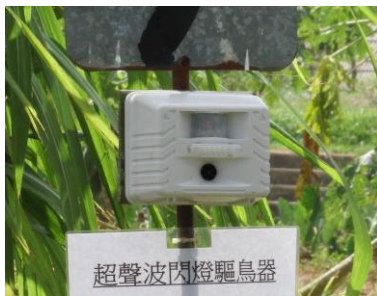
29. 驅鳥器 用於驅走野鳥，防止雀鳥為害作物。