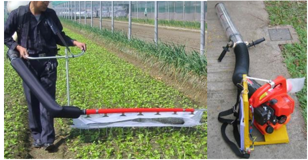
28. 捕蟲機 用於捕捉細小害蟲。