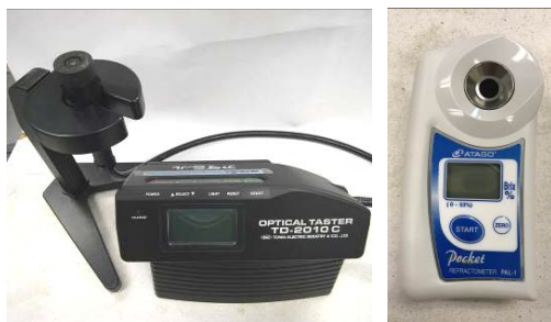
31. 電子糖度計 用於初步測試農產品的甜度，以掌握採收時機和管理農產品質量。