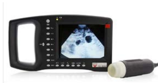
32. 豬隻測孕機 用於檢查豬隻的懷孕狀況，以加強對受孕母豬的管理和照顧，提升初生豬隻的質素。