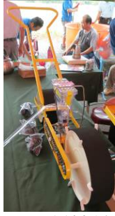
13. 種植機 用於精確地直接播種到土床上。