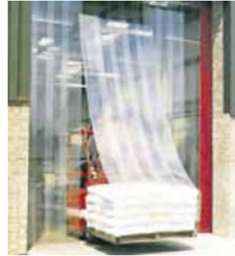
22. 隔鳥屏障 用於防止野鳥進入的 膠條簾幕或鏈索門。