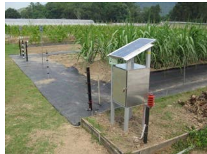
20. 電圍網 防止野生動物破壞農作物。