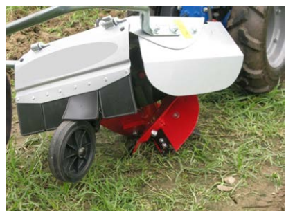
5. 旋動犁 由拖拉機驅動，用於開墾新地、 鋪設隆起的土床，以及 在堅硬土層挖掘排水坑。