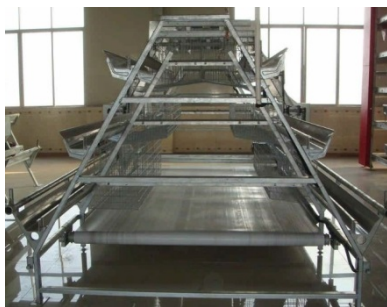
23. 輸送帶式清糞系統 用於清除雞隻糞便。