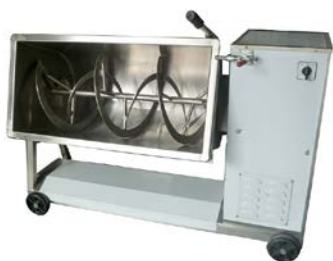
33. 混合機 用於攪拌和調配禽畜飼料，以提升禽畜養殖的質素，也可用於其他農用物資廢料，以加強農場的管理。