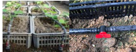
18. 灌溉系統零件和物料 用於設置灌溉系統。