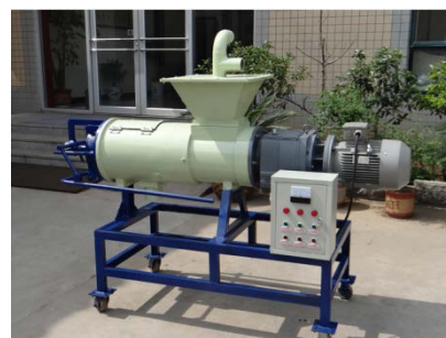
24. 固體液體廢物分離機 用於分離禽畜廢物中的固體及液體， 以提升處理效率。