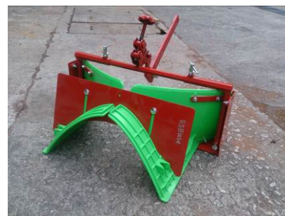
4. 起壟器 安裝於犁田機或旋耕機後方， 用於在耕作前為隆起於鬆土上 的土床定形。