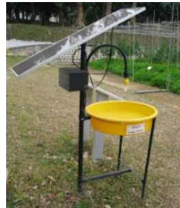
16. 誘蟲燈 用於誘捕昆蟲類害蟲， 以監控蟲害情況。