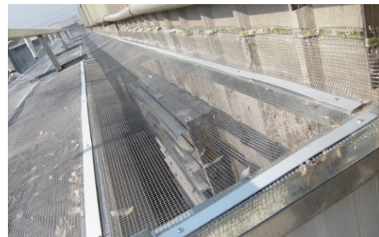
26. 灑水系統 置於雞舍抽風機外，以減少雞毛飛散。