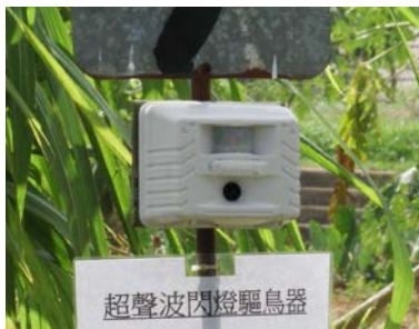
29. 驅鳥器 用於驅走野鳥，防止雀鳥為害作物。