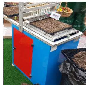
30. 苗盤播種機 用於將種子播種在苗盤上。