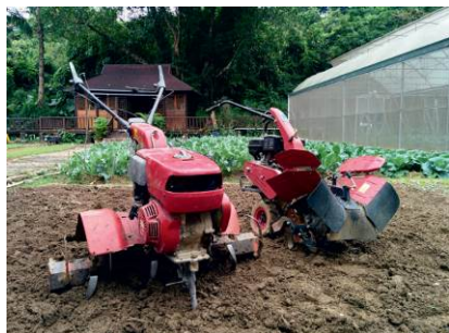
1. 犁田機 用於在耕作前翻鬆表層泥土。