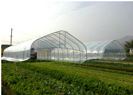
19. 保護設施零件和物料 用於豎設簡單的保護設施，以保護作物 免受豪雨及／或蟲害雀鳥等侵擾。