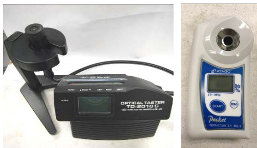
31. 電子糖度計 用於初步測試農產品的甜度，以掌握採收時機和管理農產品質量。