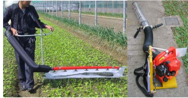
28. 捕蟲機 用於捕捉細小害蟲。