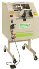
17. 蔬菜包裝機 用於包裝已收割的蔬菜。