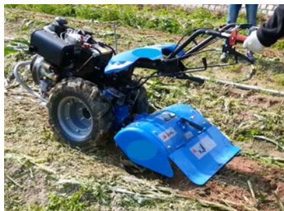
2. 拖拉機裝配的旋耕器 用於在耕作前打碎壓實的泥土。