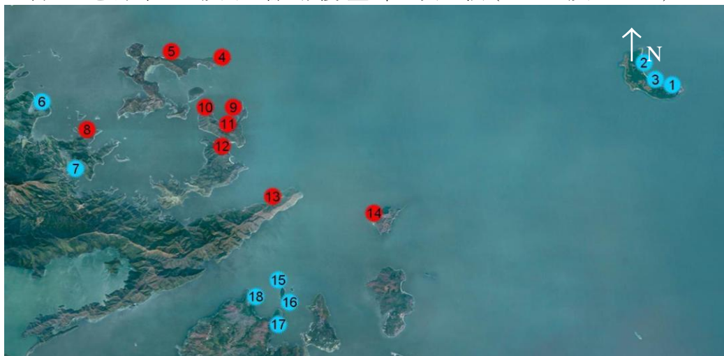
圖 1：普查地點位置及石珊瑚覆蓋率的比較(2013 及 2014)