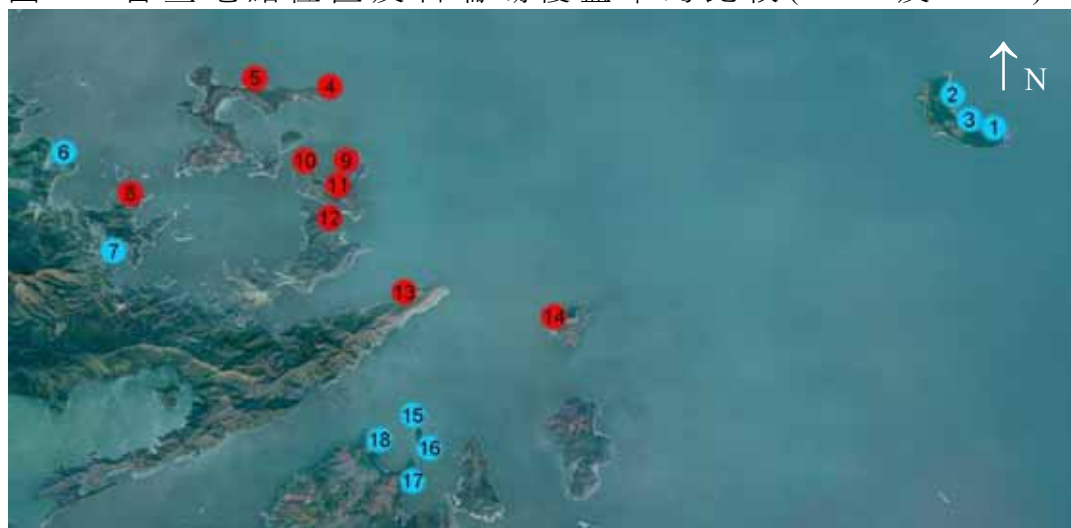
圖 1：普查地點位置及石珊瑚覆蓋率的比較(2008 及 2009)