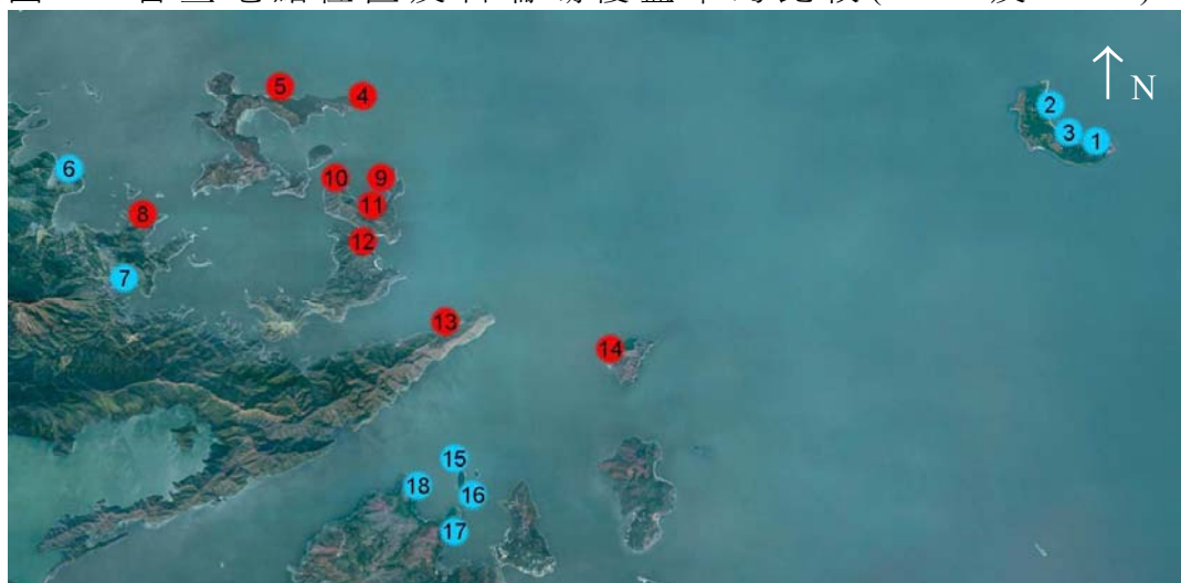
圖 1：普查地點位置及石珊瑚覆蓋率的比較(2010 及 2011)