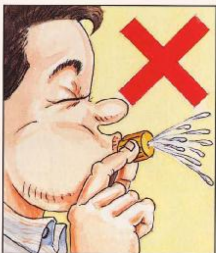
不可用口吹受阻塞的噴嘴