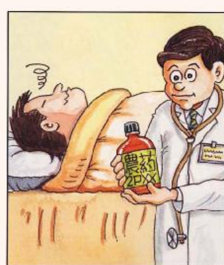
噴藥後如覺不適應立即求醫