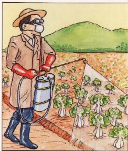
穿戴適當的保護衣物噴藥