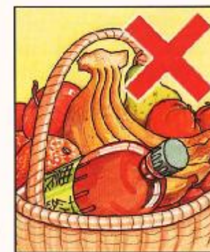
農藥不可與食物一起擺放