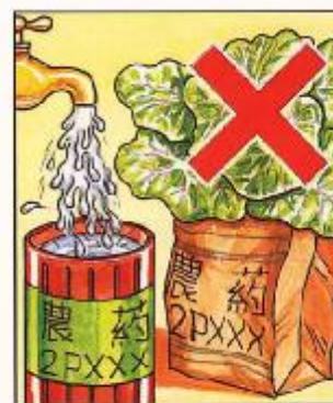
不可將農藥容器用作其它用途