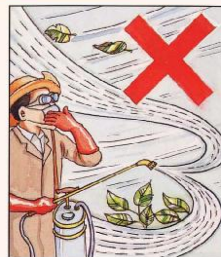
不可在大風或逆風時噴藥