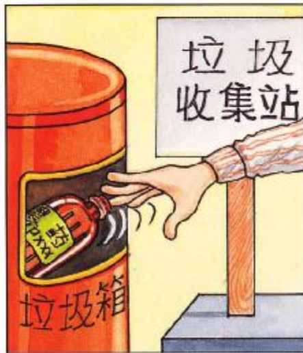
將沖洗後的農藥空瓶棄置在垃圾收集站