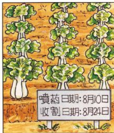
遵守安全收割日期