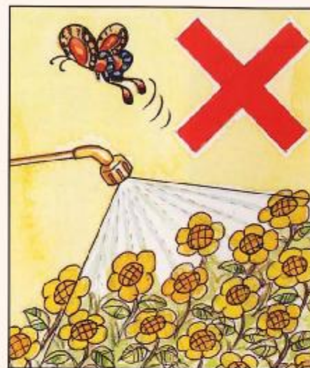
不宜在開花期噴藥