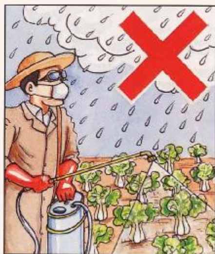
不可在下雨天噴藥