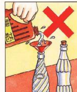
不可將農藥分存於其它容器