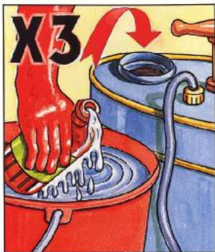
將農藥空瓶用水沖洗三次用作稀釋農藥