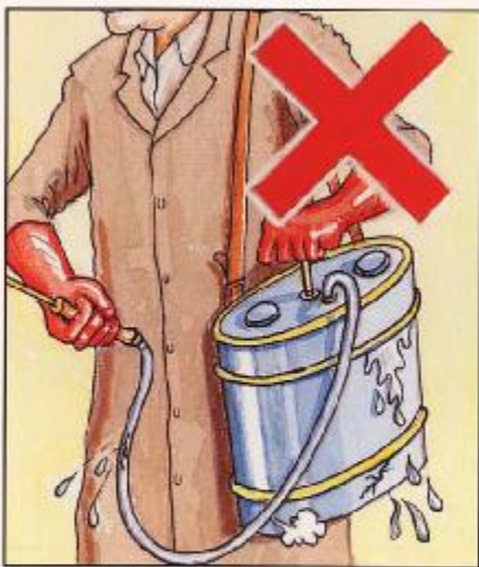
不可使用破漏噴霧器