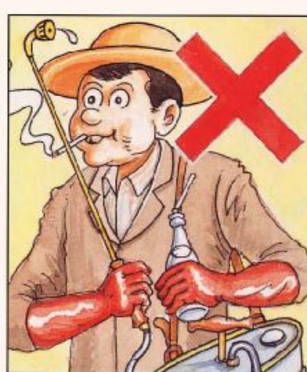
噴藥時不可飲食及吸煙