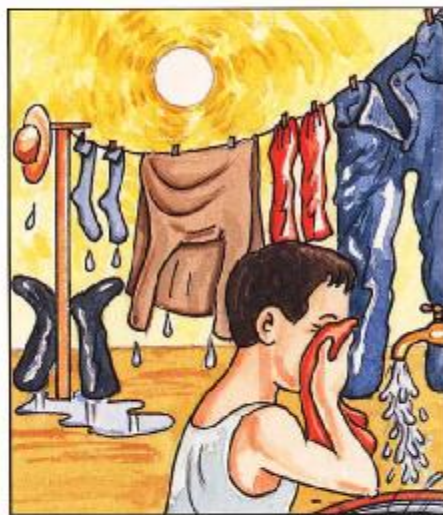
噴藥後洗滌衣物及沖洗身體