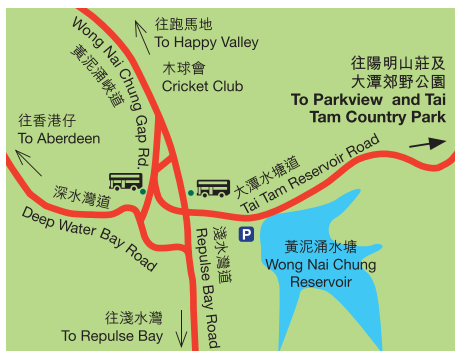
大潭郊野公園 Tai Tam Country Park