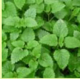
檸檬香蜂草 Lemon Balm