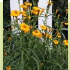
甜萬壽菊 Sweet Marigold