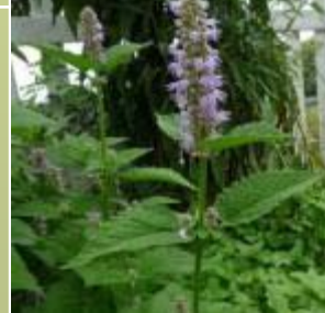
茴藿香 Anise Hyssop