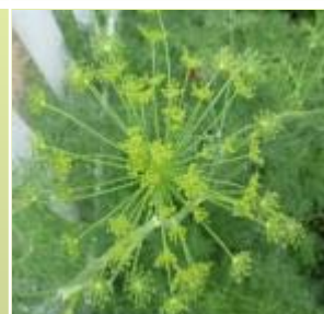
茴香 Dill, Fennel