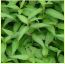
越南芫荽 Vietnamese Coriander