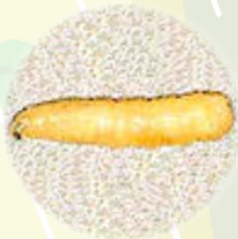
幼蟲:稱為蛆，白色，口器黑色，體長約10毫米，幼蟲老熟後能跳躍，化蛹於土中