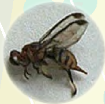
成蟲:體長約5毫米，像小黃蜂