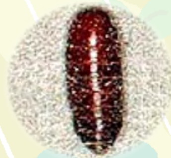
蛹:淡黃到淡褐色，長約6毫米