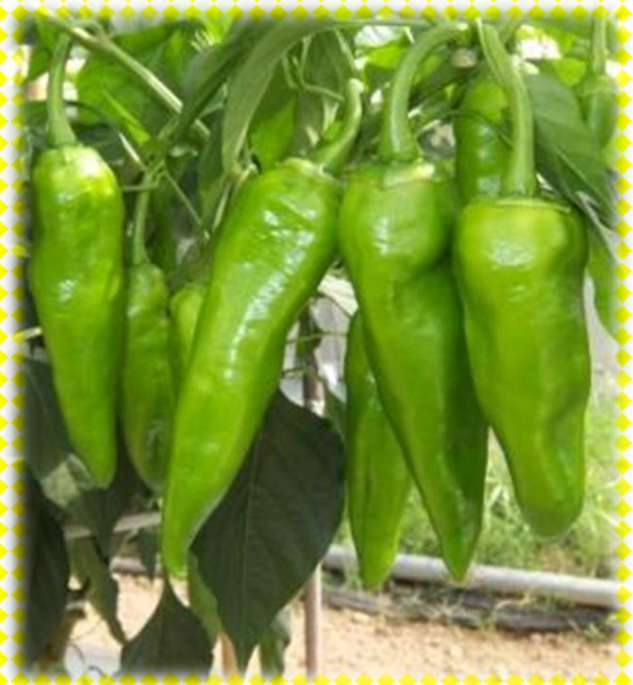
長青椒 珊瑚 Coral