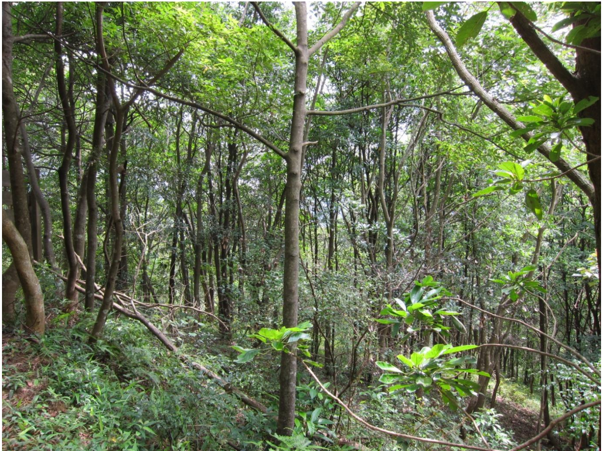
Site photo 2: The plantation site