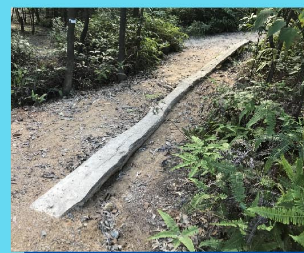
13 獨木橋 Skinny