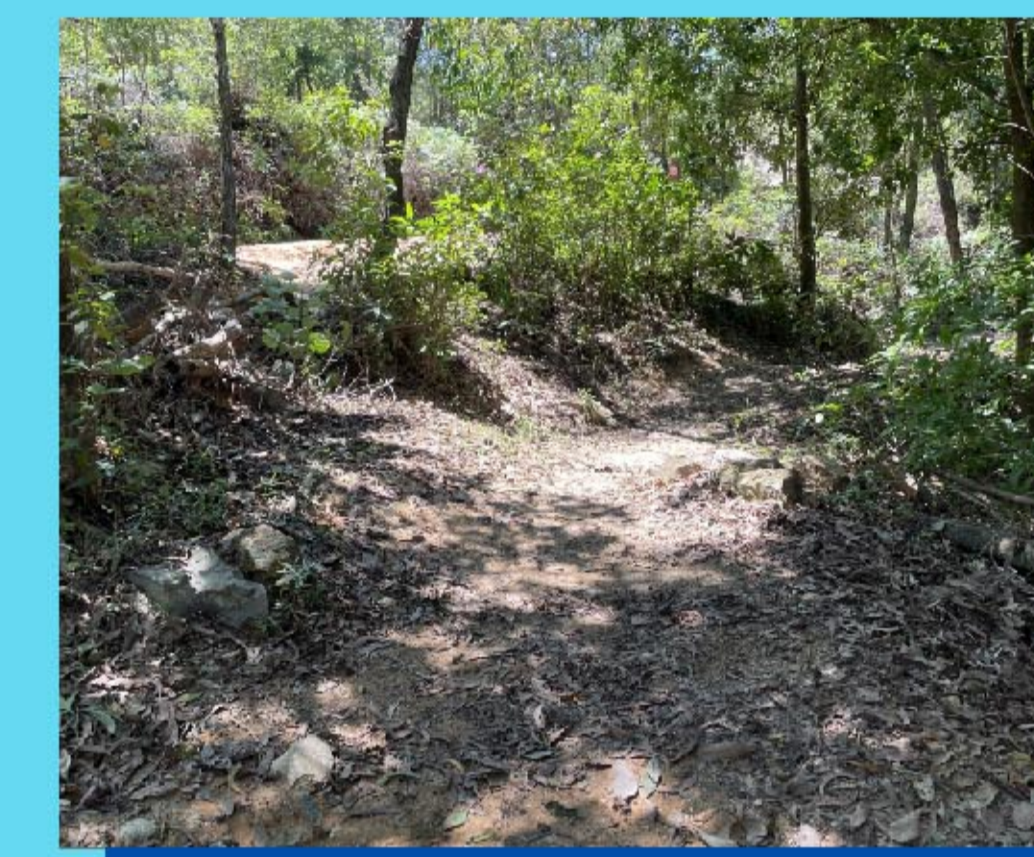
7 傾斜路面 Off camber