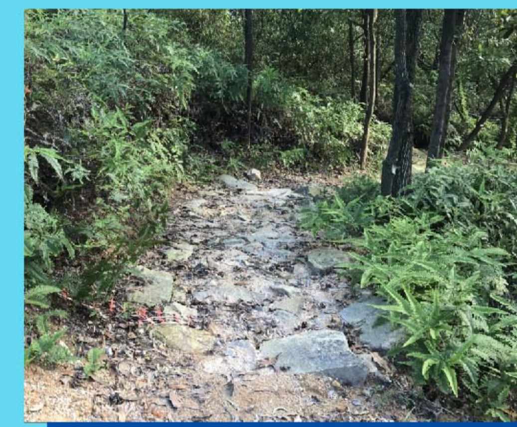
6 碎石坡道 Rock garden