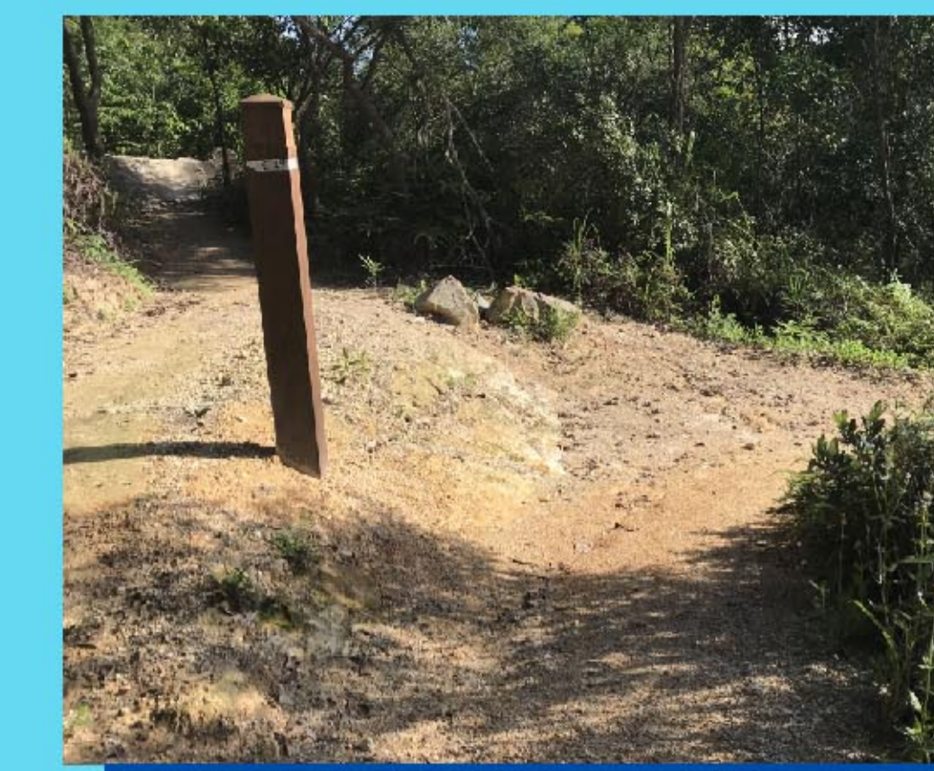
4 之形路線 Switch back