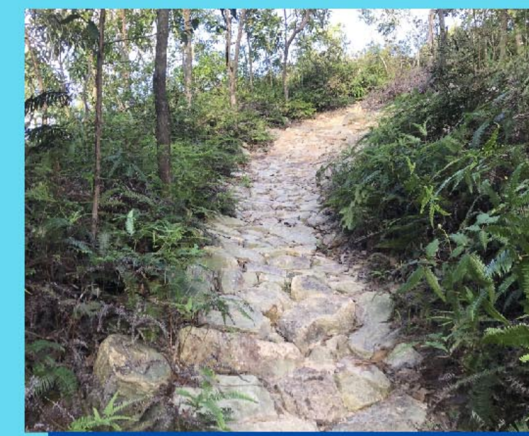
2 碎石坡道 Rock garden