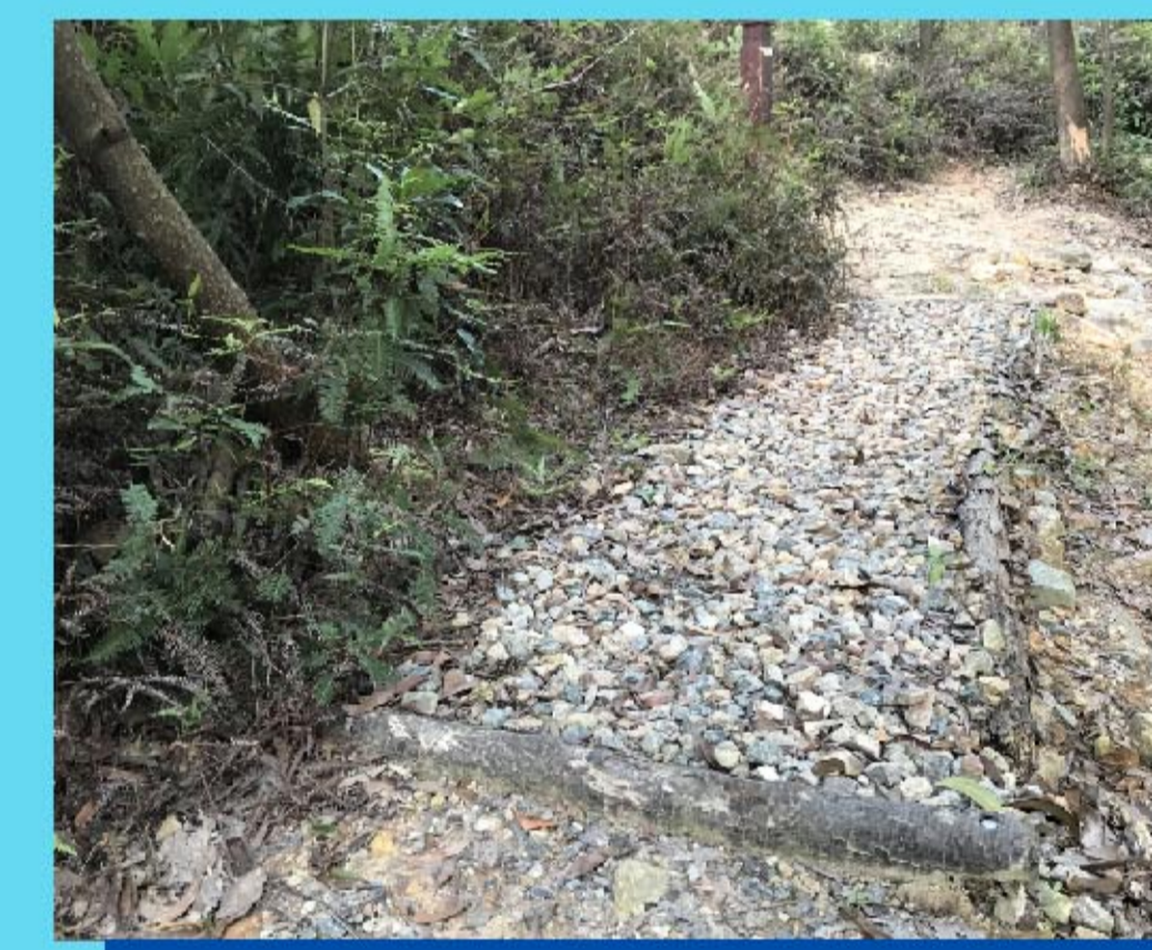
10 石池 Rock pit