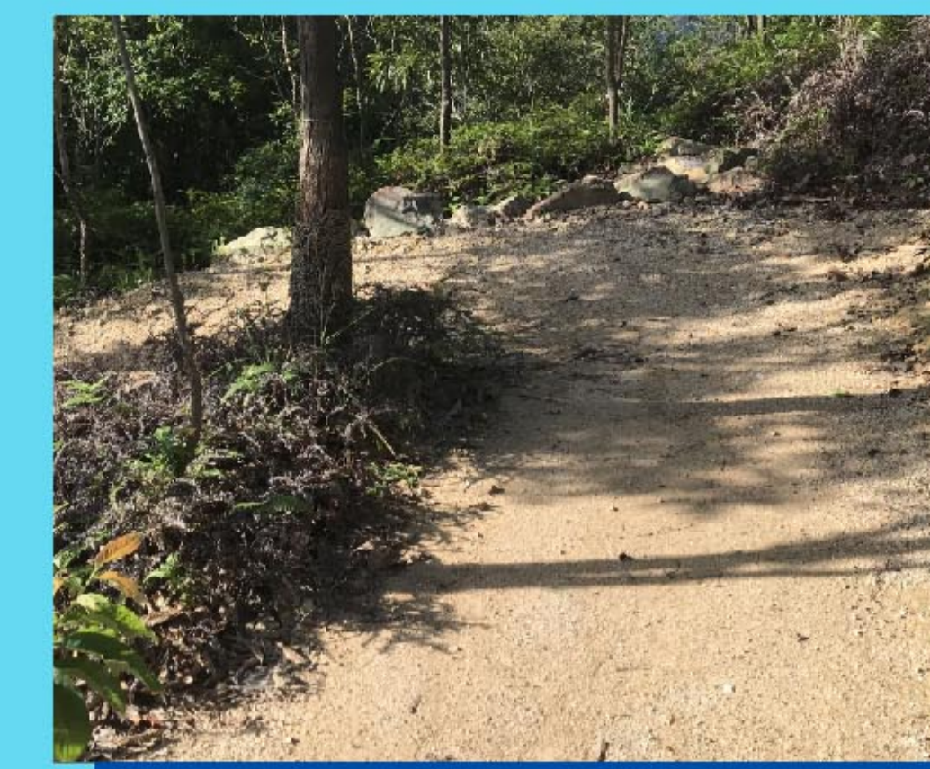
3 之形路線 Switch back