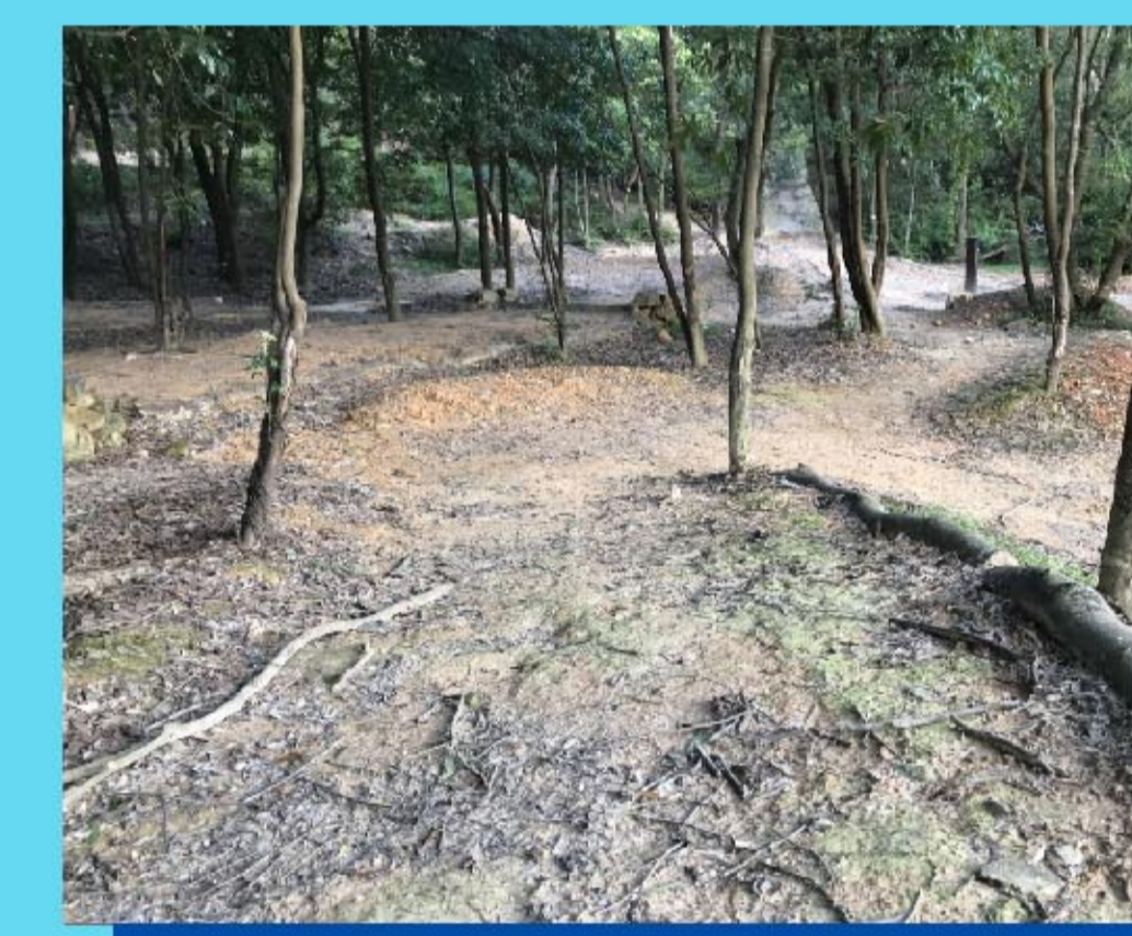
11 連彎小道 Cork screw