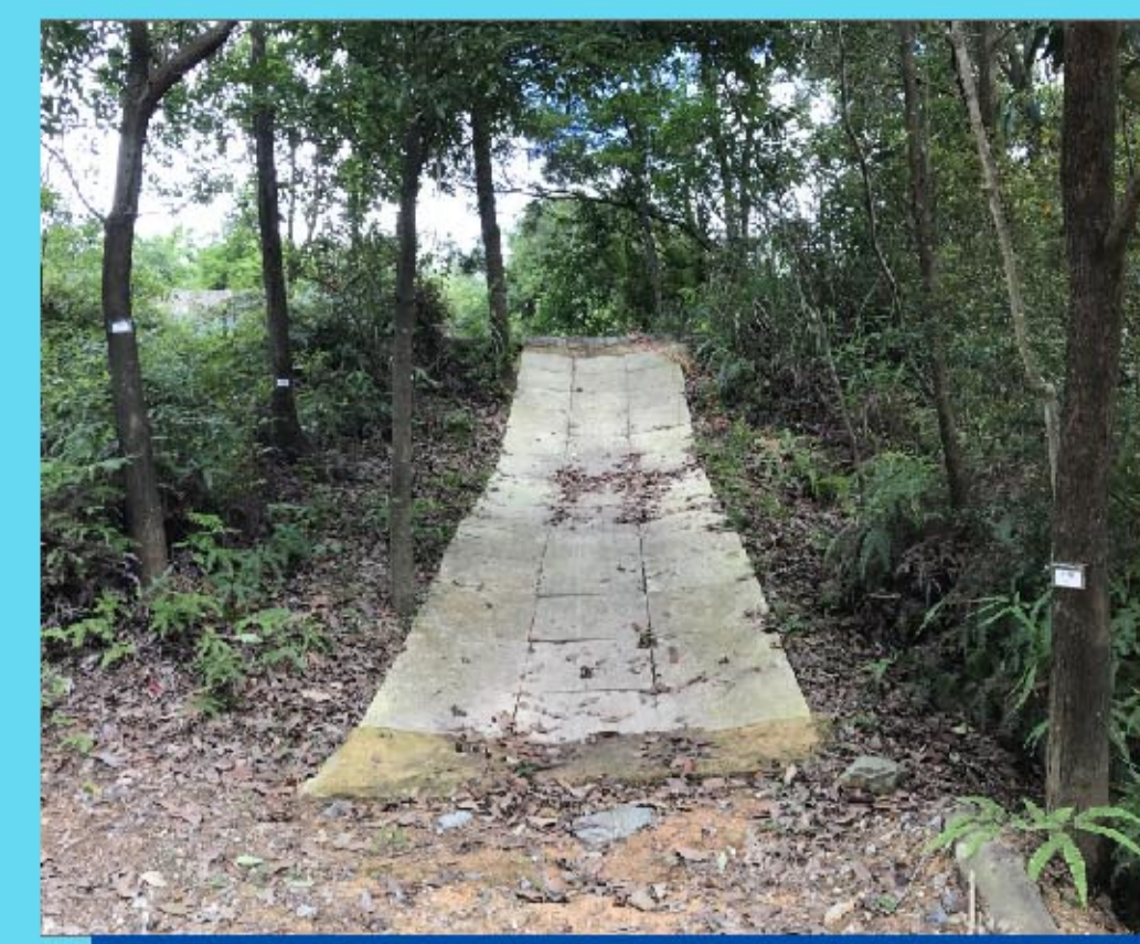
1 上坡訓練 Uphill challenge