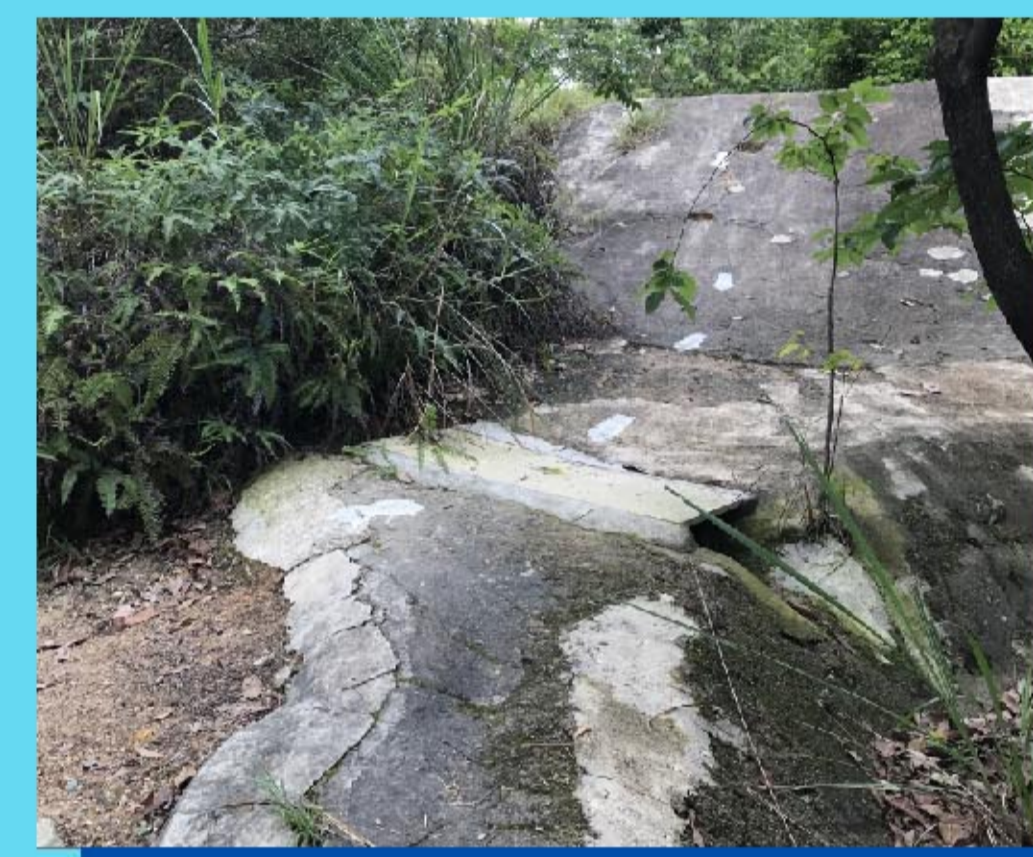
5 陡峭下坡路段 Steep descent