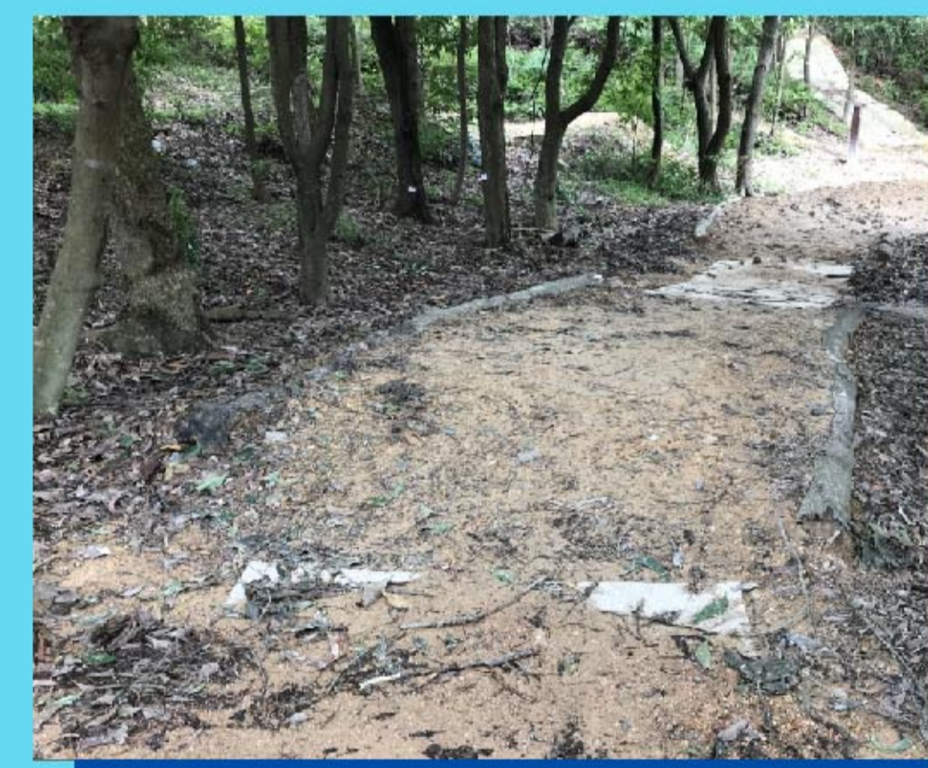
9 沙池 Sand pit