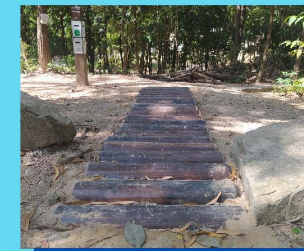
12 木頭徑道 Ladder bridge