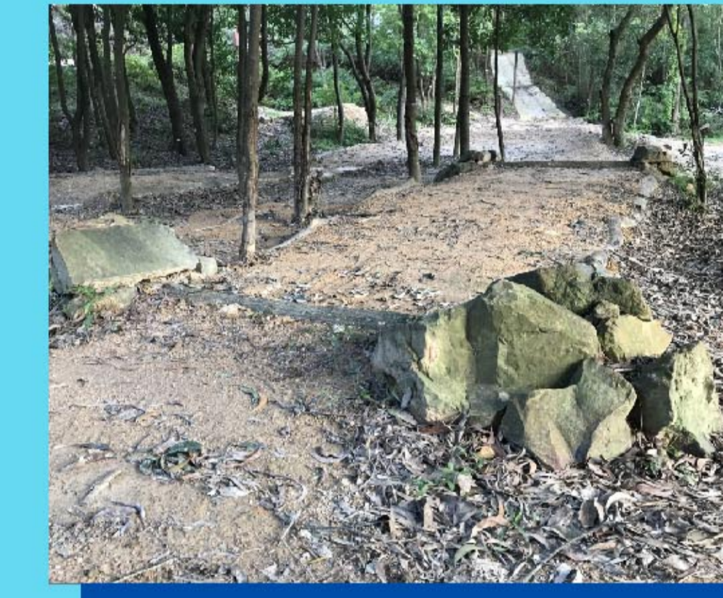
8 橫木棧道 Frontal log