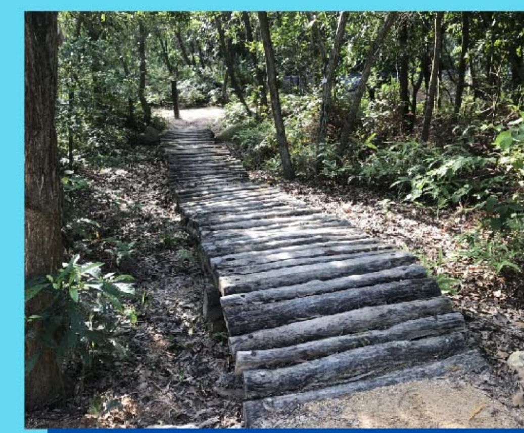
14 木頭徑道 Ladder bridge