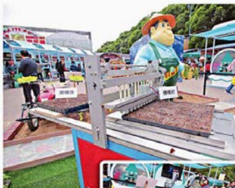
■場內展出的生產技術，包括半自動播種機。