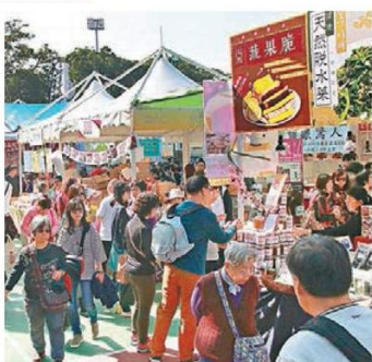
■漁農美食迎春嘉年華吸引大批市民入場。