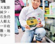
■小朋友與小豬合照。

另外，場內有不少推廣，鄭主講先生曾以魚料種植的蔬菜，羅馬生菜，以杯裝出售，一杯八十克的十多元，講說貨品皆只於超市出售，正考慮擴展至一般應「讓消費者吃得安心」。