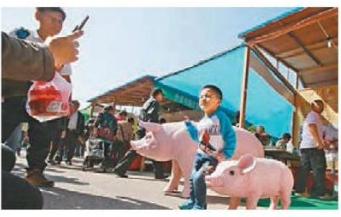
■小朋友與小豬合照。