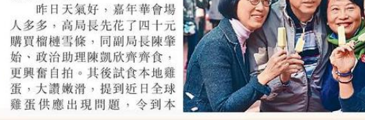
■昨日天氣好，嘉年華會場人多，高局長先花了四十元購買榴槤雪糕，同副局長陳肇始、政治助理陳凱欣齊齊食，更興奮自拍。其後試食本地雞蛋，大讚嫩滑，提到近日全球雞蛋供應出現問題，令到本

二〇一六年圓滿結束，除夕夜誰最豐收？食物及衛生局局長高永文肯定是其中一個。話說高局長昨早為本地漁農美食迎春嘉年華擔任揭幕禮嘉賓，又食又買又玩，用了三千幾蚊買龍躉買鮑魚買菜等，大力支持本地漁農業，即場食「賣飛佛」榴槤雪糕，仲被市民爭相要求合照，滿載而歸啊！