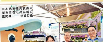
■本地漁農美食嘉年華昨日在旺角花墟公園開幕。

漁護署、農業統營處及漁類統營處合辦，一連三日的本地漁農美食嘉年華，昨日在旺角花墟公園開幕，展銷多種本地漁農產品和新鮮年華，現場人頭湧湧。嘉年華共設有超過三百八十個展銷攤位，當中約二百個攤位售賣本地出產的漁農產品，吸引大批市民到場選購。