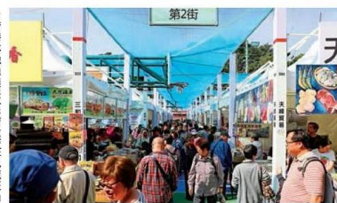
香港本地漁農美食嘉年華在九龍旺角花墟公園開幕，大批市民入場搶購。