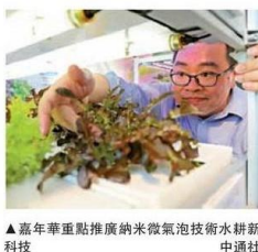
▲嘉年華重點推廣納米微氣泡技術水耕新科技