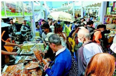
漁農美食嘉年華售賣本地產品的攤檔人山人海。

嘉年華共設有超過380個展銷攤位，當中約200個攤位售賣本地出產的漁農產品。此外，場內亦有多個本地美食、有機健康食品、廚具、家居用品攤位。嘉年華亦設有各式各樣的節目，包括文娛表演、烹飪示範及互動遊戲，適合一家大小參加。活動入場費用全免。嘉年華由上午10時至晚上8時舉行，其間有免費穿梭巴士往來港鐵石硤尾站B1窩仔街出口。