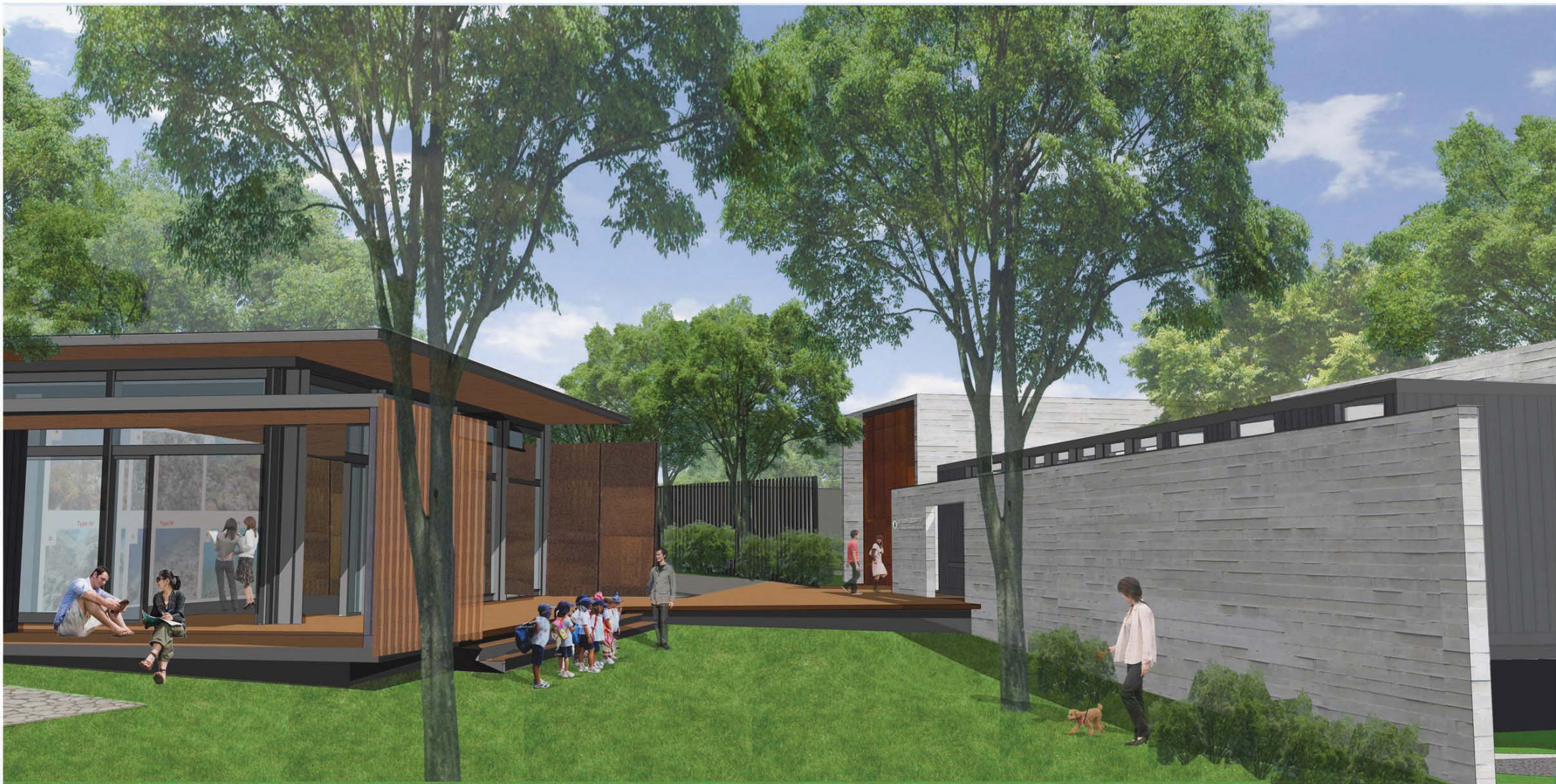
海下灣海岸公園遊客中心的構想圖 Artist's Impression of the Hoi Ha Wan Marine Park Visitor Centre