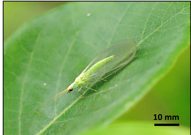
圖 4：成蟲多為草綠色，有一對半透明薄翅，長約 15 - 20mm