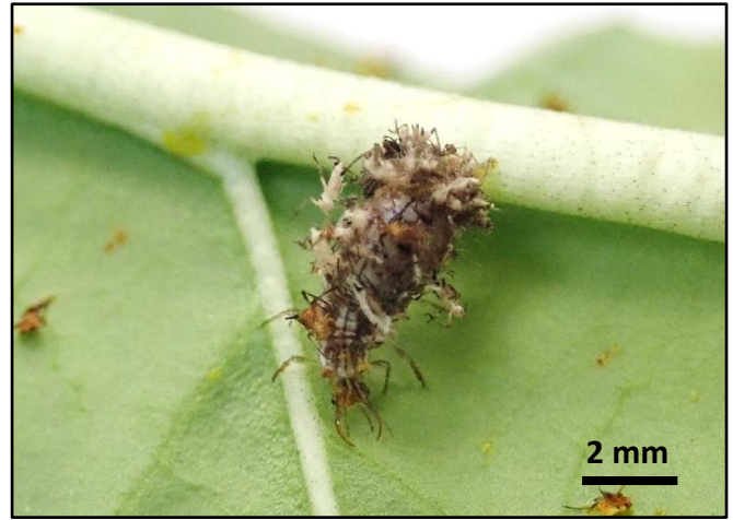
圖 2：蚜獅呈紡錘形，有一對強勁的大鉗，體長約 5mm