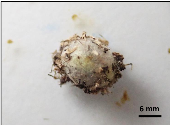
圖 3：蛹呈橢圓形，呈灰白色，長約 12mm