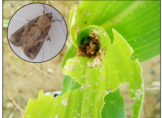
圖 2：幼蟲喜蛀食玉米粟的芯葉