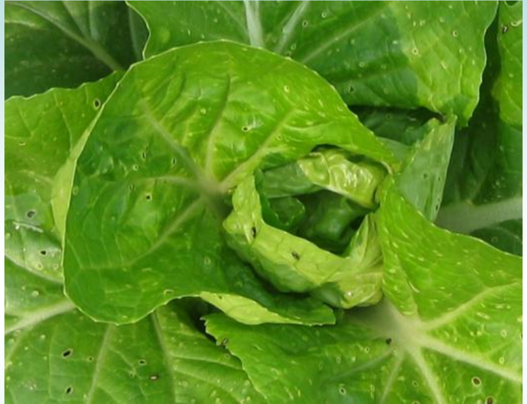
作物受狗蟲仔為害