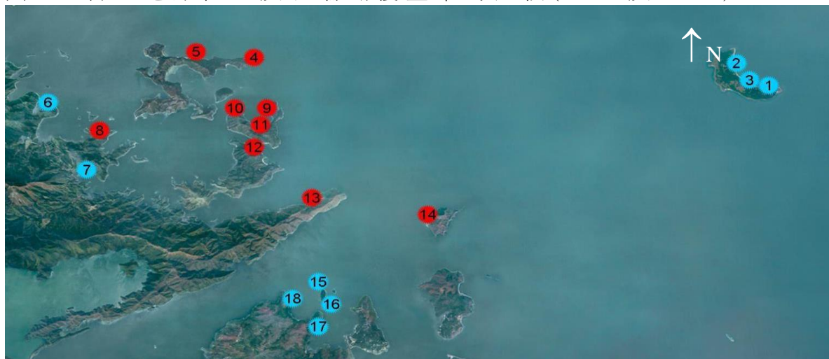
圖 1：普查地點位置及石珊瑚覆蓋率的比較(2020 及 2021)