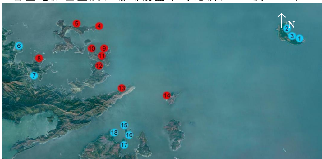
圖 1：普查地點位置及石珊瑚覆蓋率的比較(2013 及 2014)