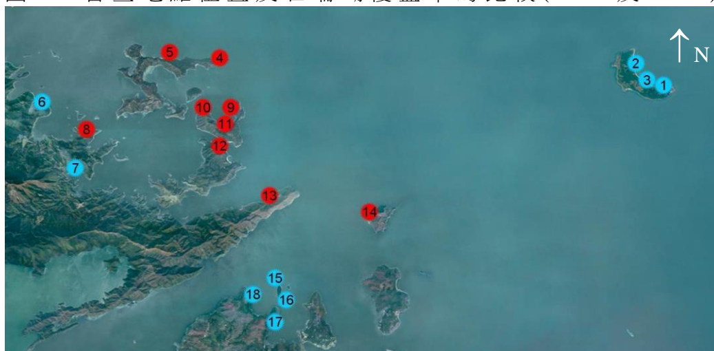
圖 1：普查地點位置及石珊瑚覆蓋率的比較(2017 及 2018)