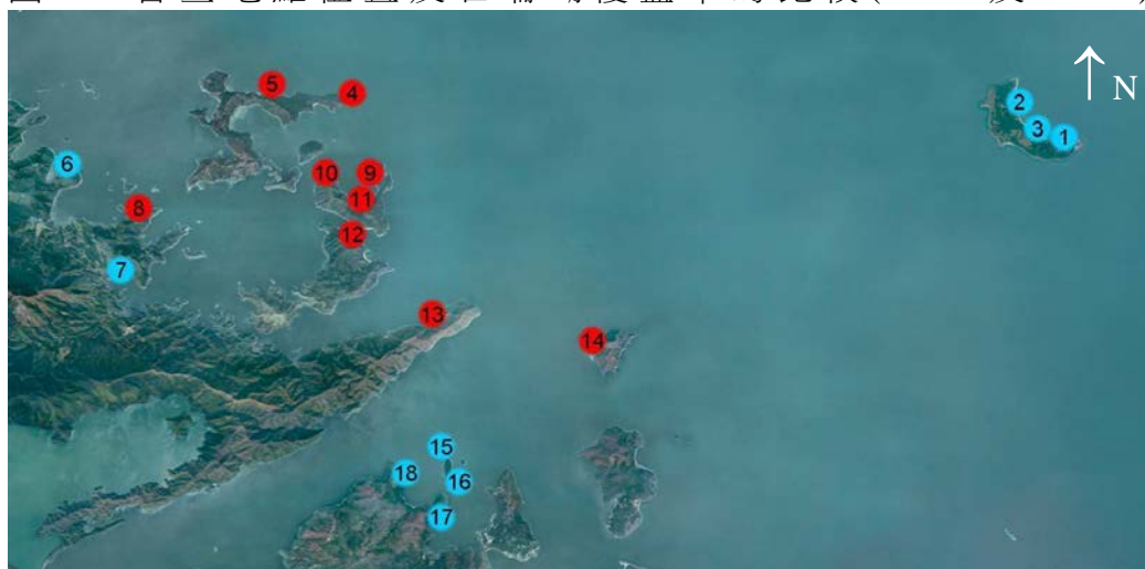
圖 1：普查地點位置及石珊瑚覆蓋率的比較(2018 及 2019)