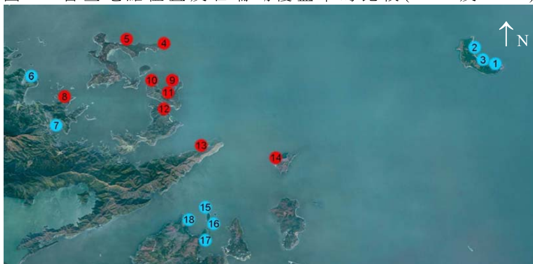
圖 1：普查地點位置及石珊瑚覆蓋率的比較(2019 及 2020)