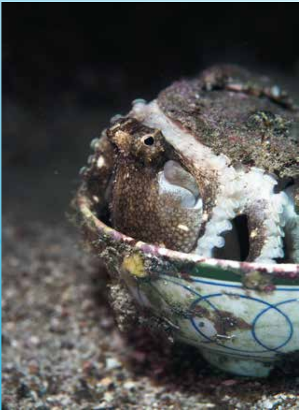
Dinner time (赤洲)