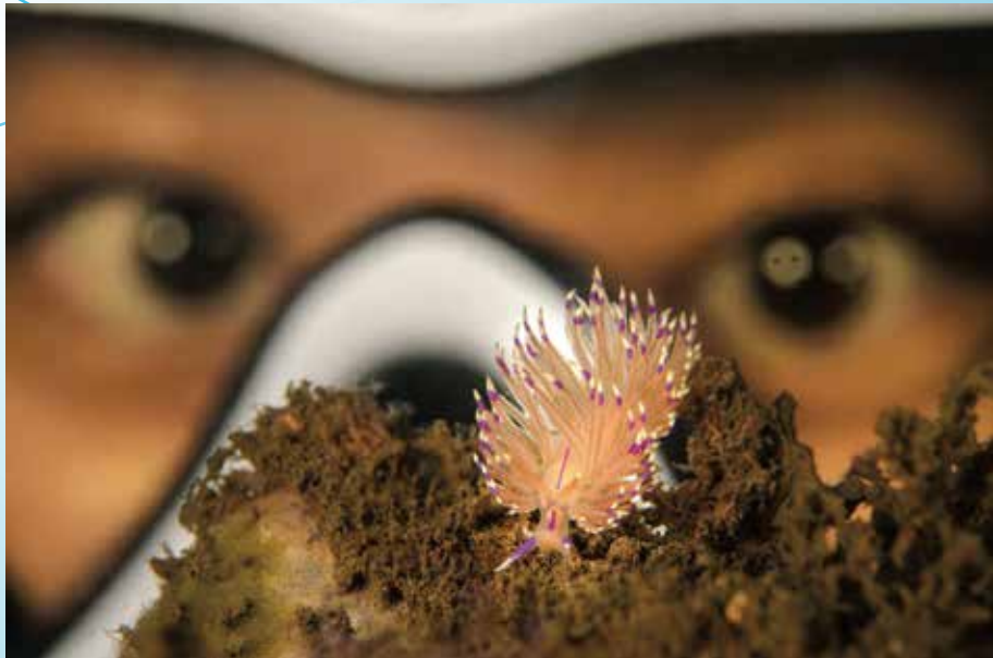
I'm watching you (海下)