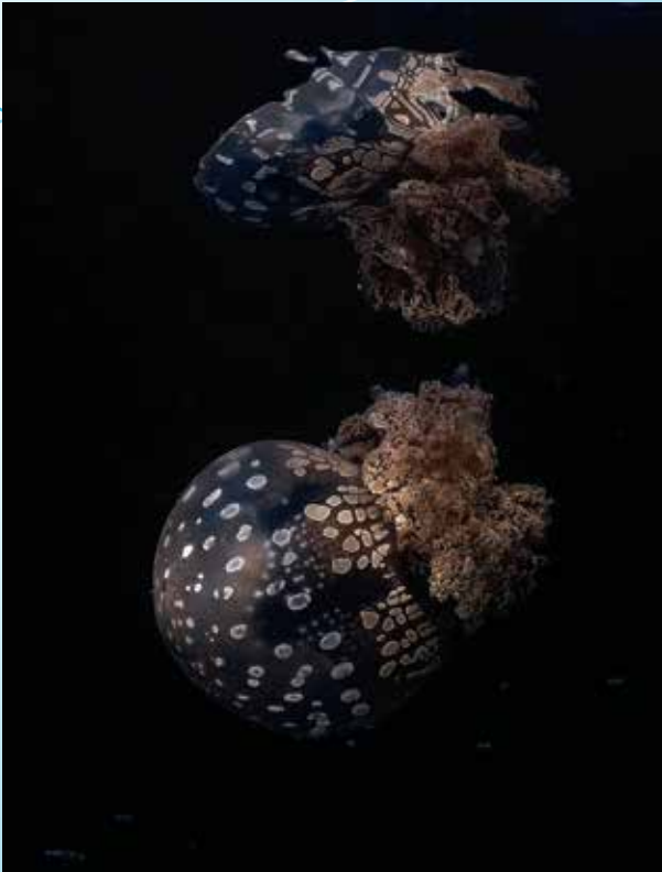
Graceful Dancer (海下)