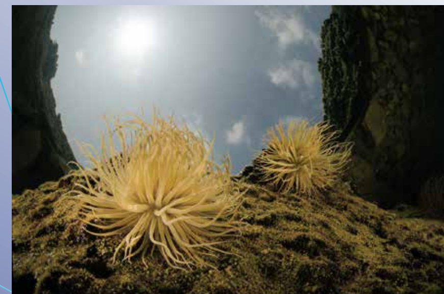
Blue Water Mangrove