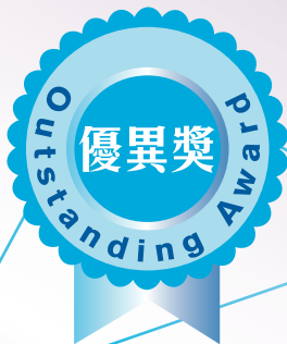
黎永洪 Lai Wing Hung