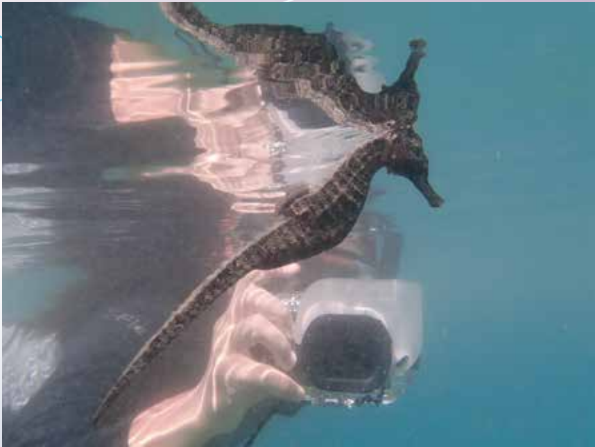
Dear seahorse, we will meet again! (赤門)