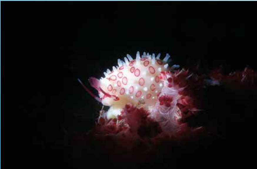
Red lychee (果洲)