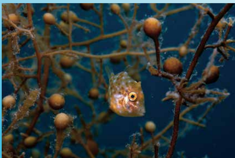
Mind the Mine