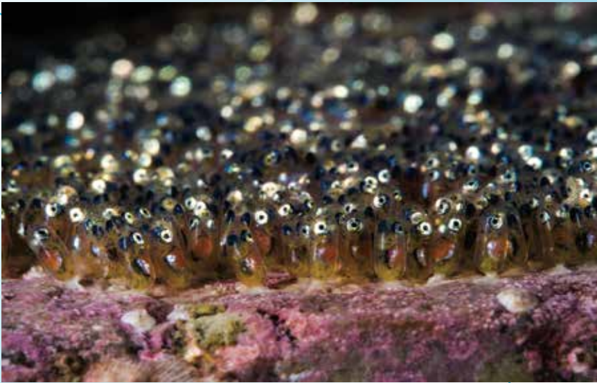
海底迷你兵團 (火石洲)