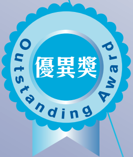
黎永洪 Lai Wing Hung