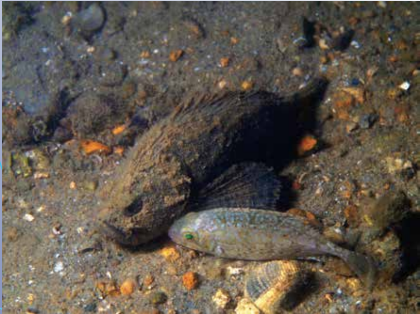
唔好嬲啦，錫番！ (龍尾)