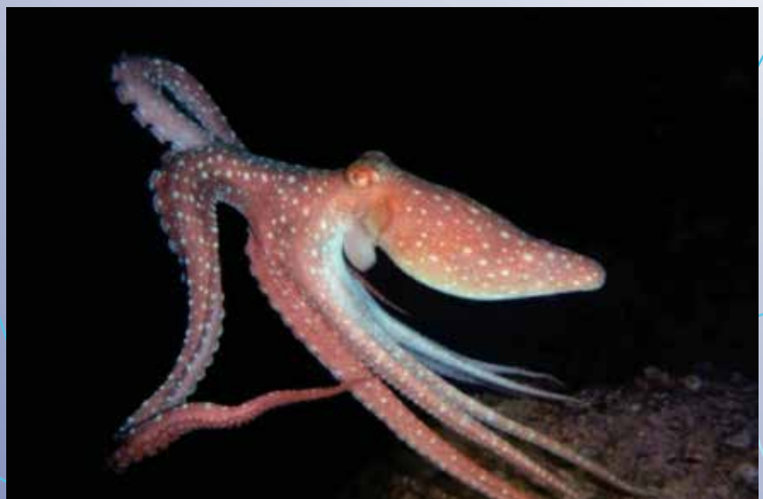
飛舞中的八爪魚 (西貢海)