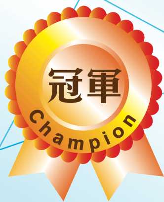
鄧偉堅 Tang Wai Kin