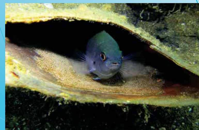
生生不息的生命 (黃尾石剎那間&魚卵) (海下)